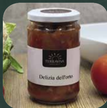
Delizia dell'Orto gr 290