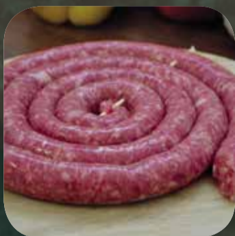
Salsiccia Mista di Bovino Fassone gr 500