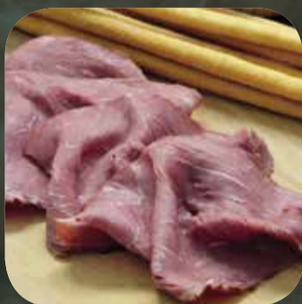
Manzo Affumicato Piemontese gr 100