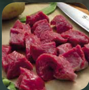
Bocconcini di Bovino Fassone gr 300