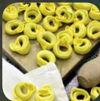
Tortellini Prosciutto Crudo gr 250